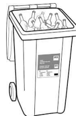
Pieni astia, keskipaino 70 kg, vetoisuus 240 l Leveys x korkeus x syvyys (cm): 58,0 x 107,5 x 72,5